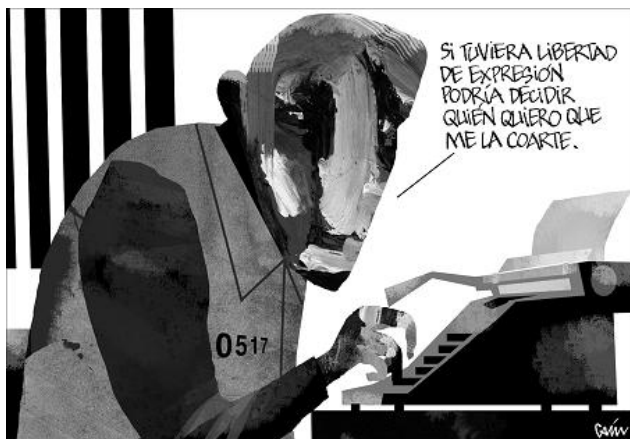
CAIN (La Razón)

Una exposición de Reporteros Sin Fronteras