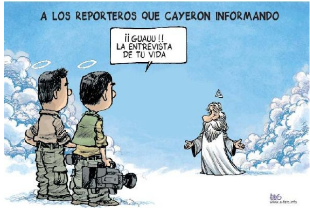
FARD (Diari de Tarragona)