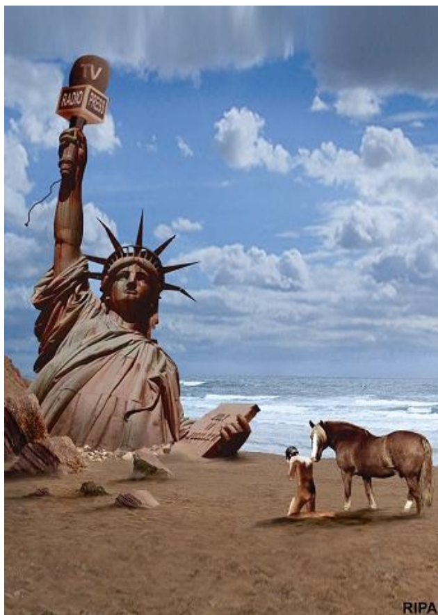
RIPA (Deia y Caduca Hoy)

Afortunadamente, esta apuesta se mantiene viva a día de hoy y nos permite presentar esta exposición de aportaciones en defensa de la libertad de expresión como respuesta a la convocatoria que Reporteros Sin Fronteras hace cada 3 de mayo, en sintonía con el Día Internacional de la Libertad de Prensa, declarado por la Asamblea General de la UNESCO.