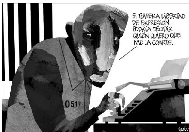
CAIN (La Razón)

Una exposición de Reporteros Sin Fronteras